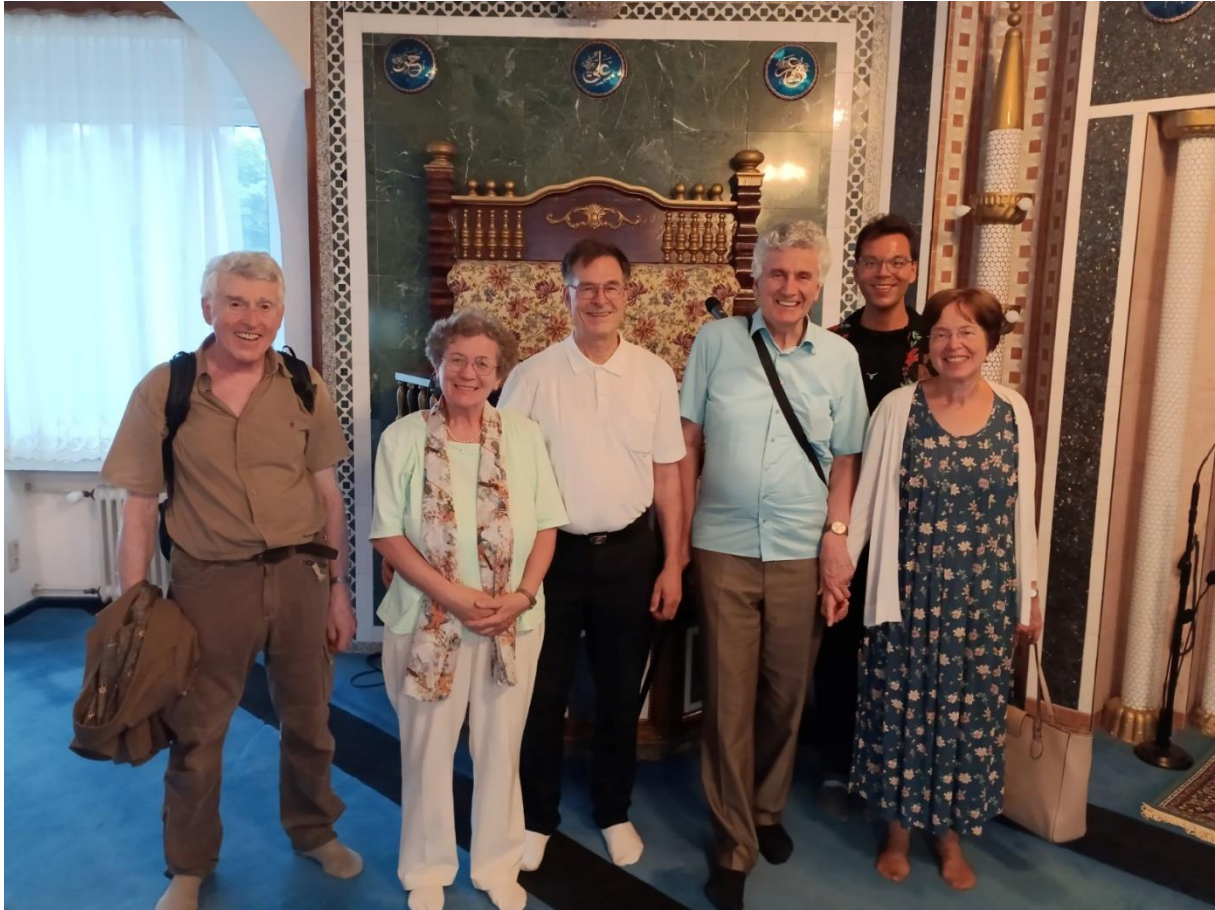
Bericht von Robert Bentele

Zum Abschluss konnten wir uns noch an türkischen Delikatessen, die im Hof des Hauses bei einem kleinen Jahrmarkt angeboten wurden, erfreuen.