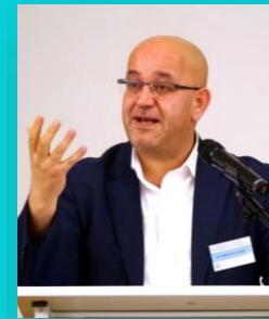
Abdel-Hakim Ourghi (Professor für Islamische Theologie): 40 Thesen zur Reform des Islam